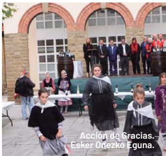
Acción de Gracias. Esker Oinezko Eguna.