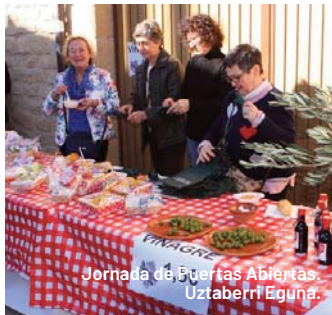
Jornada de Puertas Abiertas. Uztaberri Eguna.